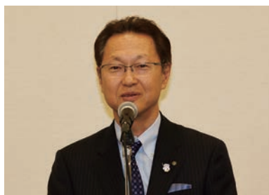
茂木浩 千葉県税理士会会長挨拶